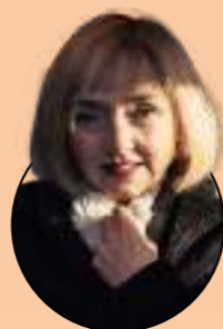
Maria de Medeiros