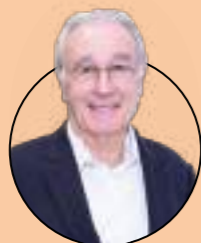
Bernard Le Coq