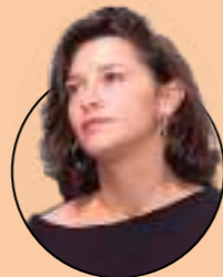
Emma de Caunes